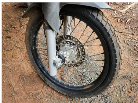
PNEU DIANTEIRO DIREITO