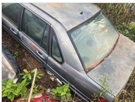
COLUNA CENTRAL ESQ