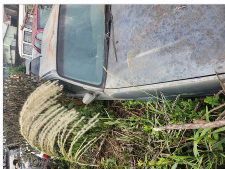
COLUNA CENTRAL DIR