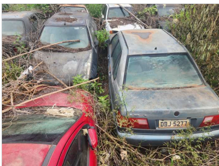
TRASEIRA DIAGONAL ESQUERDA