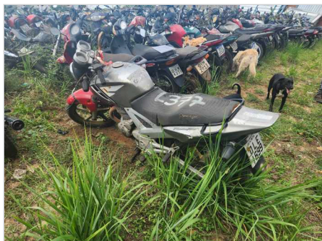
TRASEIRA DIAGONAL ESQUERDA