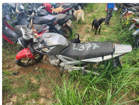
COLUNA CENTRAL ESQ