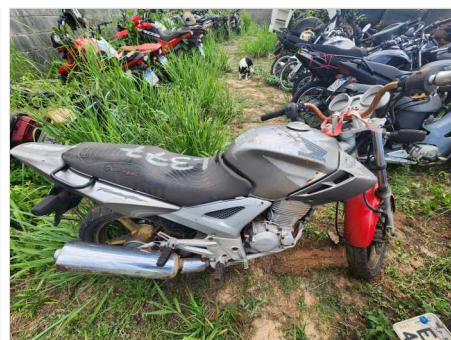
COLUNA CENTRAL DIR