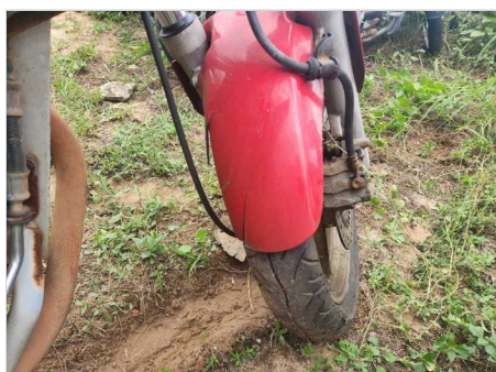
PNEU DIANTEIRO DIREITO