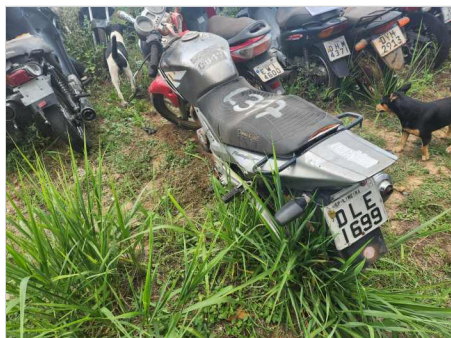
TRASEIRA DIAGONAL ESQUERDA