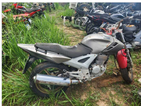
COLUNA CENTRAL DIR