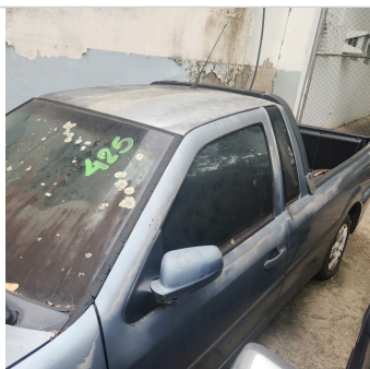
COLUNA CENTRAL ESQ