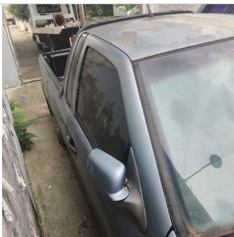
COLUNA CENTRAL DIR