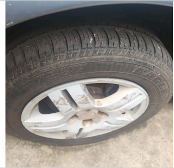
PNEU DIANTEIRO DIREITO