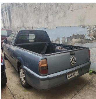
TRASEIRA DIAGONAL ESQUERDA