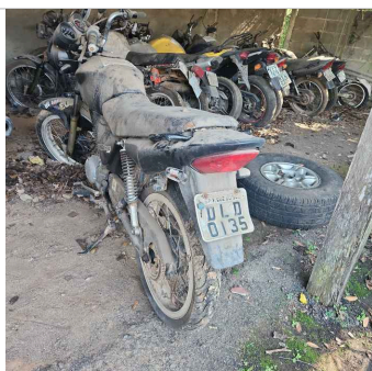
TRASEIRA DIAGONAL ESQUERDA