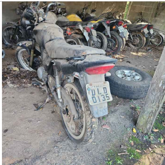
TRASEIRA DIAGONAL ESQUERDA