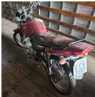
TRASEIRA DIAGONAL ESQUERDA