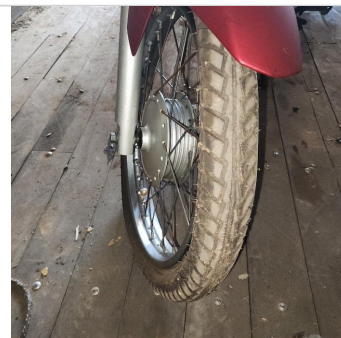
PNEU DIANTEIRO DIREITO