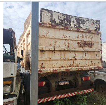
TRASEIRA DIAGONAL ESQUERDA