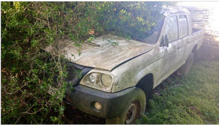
DIANTEIRA DIAGONAL DIREITA