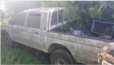
TRASEIRA DIAGONAL DIREITA