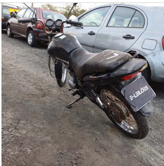
COLUNA TRASEIRA ESQ