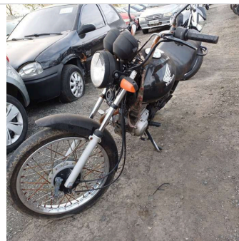
DIANTEIRA DIAGONAL ESQUERDA