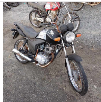
DIANTEIRA DIAGONAL DIREITA