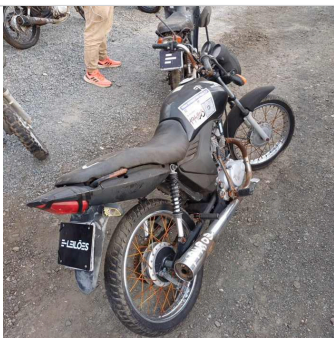
TRASEIRA DIAGONAL DIREITA