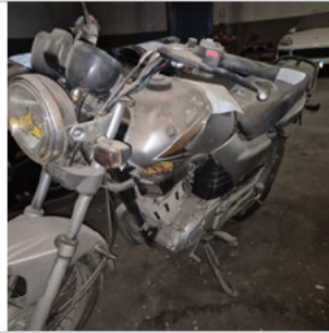
COLUNA DIANTEIRA ESQ