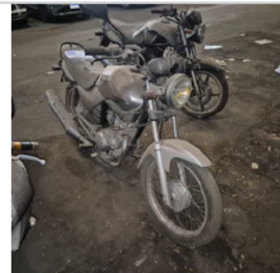
DIANTEIRA DIAGONAL DIREITA