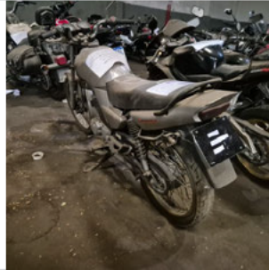
COLUNA TRASEIRA ESQ