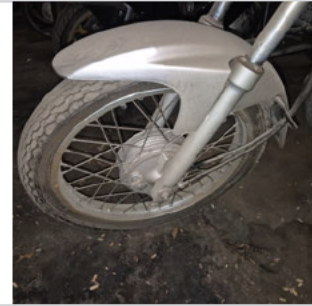
PNEU DIANTEIRO ESQUERDO