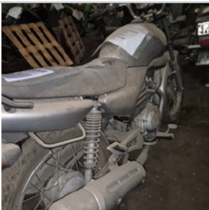
COLUNA TRASEIRA DIR