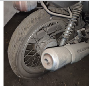
PNEU TRASEIRO DIREITO