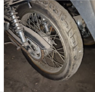
PNEU TRASEIRO ESQUERDO