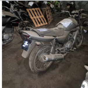
TRASEIRA DIAGONAL DIREITA