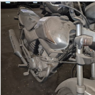
COLUNA DIANTEIRA DIR