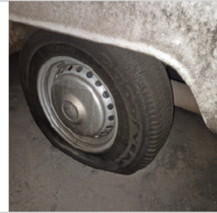
PNEU TRASEIRO ESQUERDO