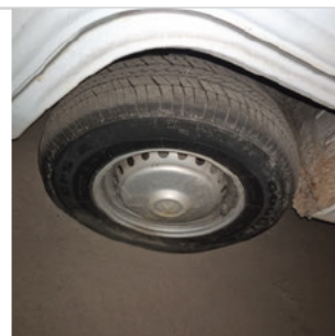
PNEU DIANTEIRO ESQUERDO