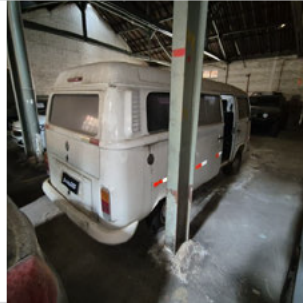
TRASEIRA DIAGONAL DIREITA