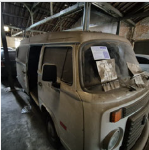
COLUNA DIANTEIRA DIR