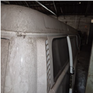
COLUNA TRASEIRA DIR