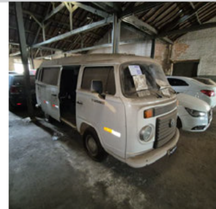
DIANTEIRA DIAGONAL DIREITA