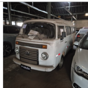
DIANTEIRA DIAGONAL ESQUERDA