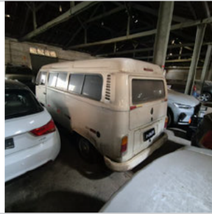
COLUNA TRASEIRA ESQ