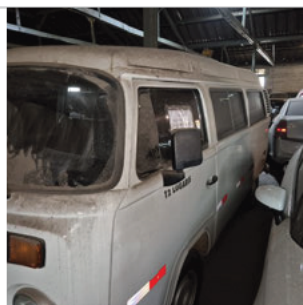
COLUNA DIANTEIRA ESQ