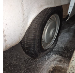
PNEU TRASEIRO DIREITO