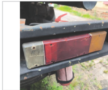
Lanterna Traseira Direita: ⊘ Avariado