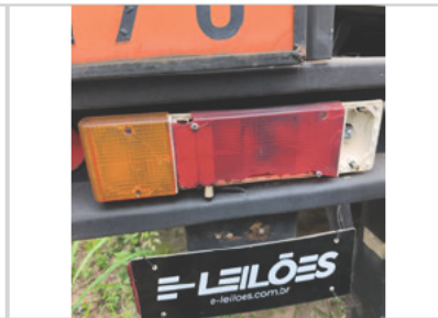
Lanterna Traseira Esquerda: ⊘ Avariado