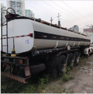
TRASEIRA DIAGONAL DIREITA