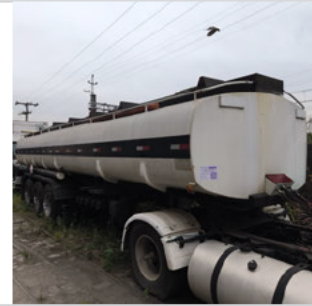
DIANTEIRA DIAGONAL DIREITA