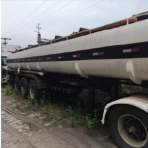
COLUNA DIANTEIRA DIR