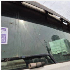
Parabrisa Dianteiro: Avariado