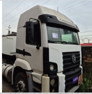
COLUNA DIANTEIRA DIR