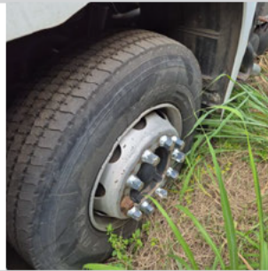
PNEU DIANTEIRO ESQUERDO