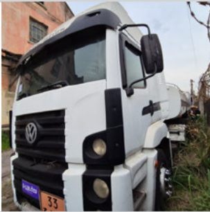
COLUNA DIANTEIRA ESQ