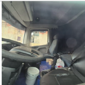
Forração Do Teto: OK