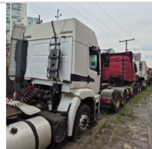
COLUNA TRASEIRA DIR