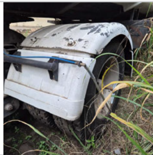
PNEU TRASEIRO ESQUERDO