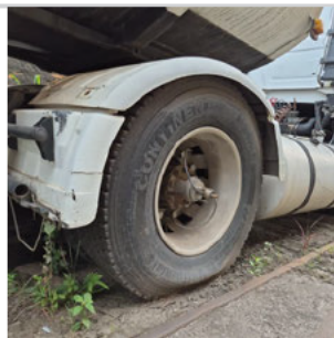
PNEU TRASEIRO DIREITO