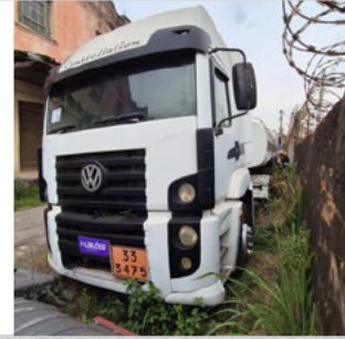
DIANTEIRA DIAGONAL ESQUERDA