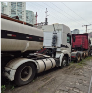
TRASEIRA DIAGONAL DIREITA