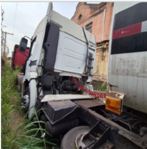
COLUNA TRASEIRA ESQ