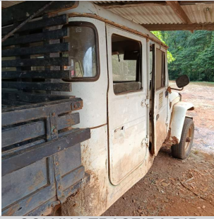
COLUNA TRASEIRA DIR