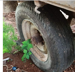
PNEU TRASEIRO ESQUERDO