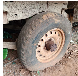
PNEU TRASEIRO DIREITO