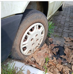
PNEU DIANTEIRO ESQUERDO