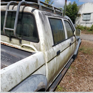
COLUNA TRASEIRA DIR