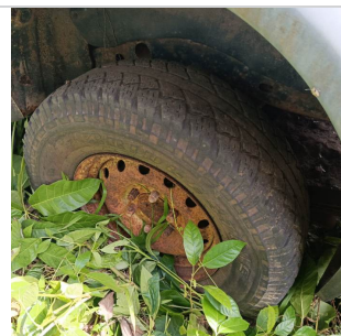
PNEU TRASEIRO ESQUERDO