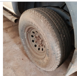
PNEU TRASEIRO ESQUERDO