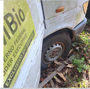
PNEU DIANTEIRO ESQUERDO