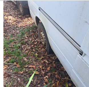
PNEU TRASEIRO DIREITO