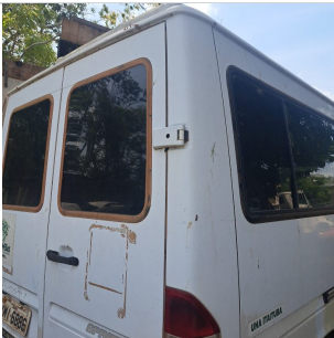
COLUNA TRASEIRA DIR