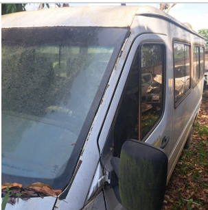
COLUNA DIANTEIRA DIR