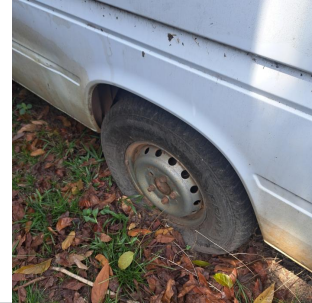
PNEU TRASEIRO ESQUERDO