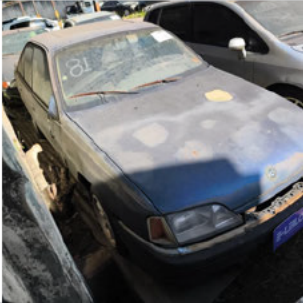
DIANTEIRA DIAGONAL DIREITA