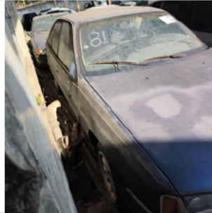
COLUNA DIANTEIRA DIR