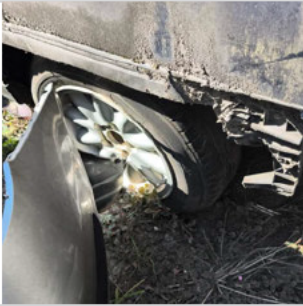
PNEU TRASEIRO ESQUERDO