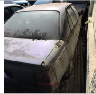
COLUNA TRASEIRA DIR