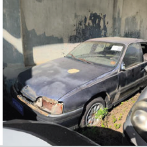
DIANTEIRA DIAGONAL ESQUERDA