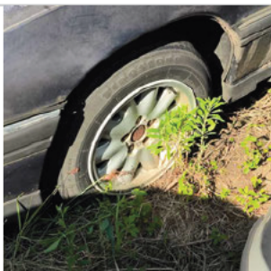
PNEU DIANTEIRO ESQUERDO