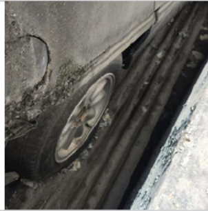
PNEU TRASEIRO DIREITO