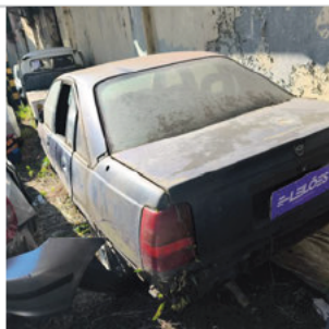
COLUNA TRASEIRA ESQ