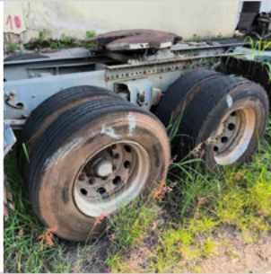
PNEU TRASEIRO DIREITO