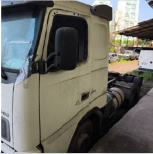
COLUNA DIANTEIRA ESQ