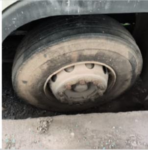
PNEU DIANTEIRO ESQUERDO