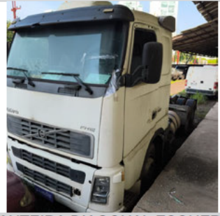
DIANTEIRA DIAGONAL ESQUERDA