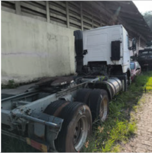
TRASEIRA DIAGONAL DIREITA