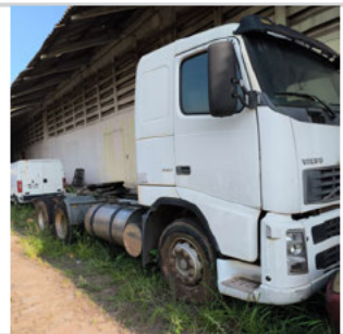
COLUNA DIANTEIRA DIR