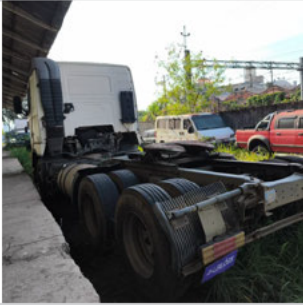
COLUNA TRASEIRA ESQ