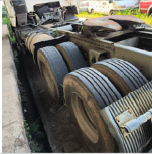
PNEU TRASEIRO ESQUERDO