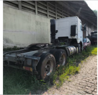
COLUNA TRASEIRA DIR