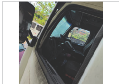
Vidro Da Porta Dianteira Esquerda: