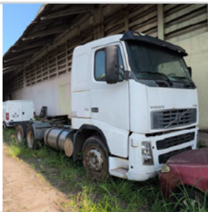
DIANTEIRA DIAGONAL DIREITA