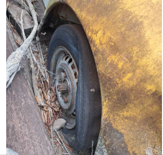
PNEU TRASEIRO ESQUERDO