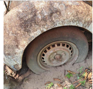
PNEU TRASEIRO DIREITO