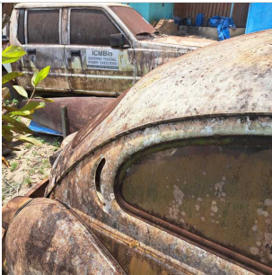
COLUNA TRASEIRA DIR