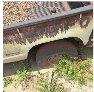
PNEU TRASEIRO DIREITO