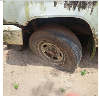
PNEU DIANTEIRO ESQUERDO