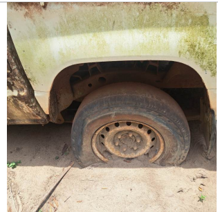
PNEU TRASEIRO ESQUERDO