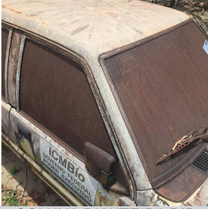
COLUNA DIANTEIRA DIR