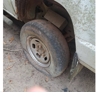
PNEU TRASEIRO ESQUERDO