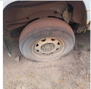
PNEU TRASEIRO DIREITO