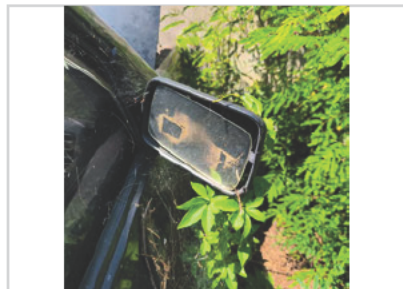
Retrovisor Lado Direito: