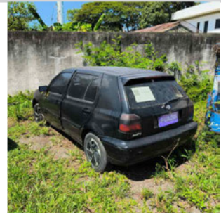
COLUNA TRASEIRA ESQ