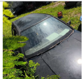
COLUNA DIANTEIRA DIR