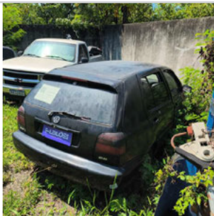
TRASEIRA DIAGONAL DIREITA