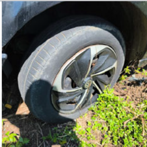
PNEU DIANTEIRO ESQUERDO