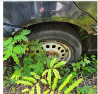
PNEU TRASEIRO DIREITO