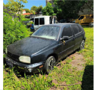
DIANTEIRA DIAGONAL ESQUERDA