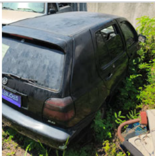
DIANTEIRA DIAGONAL DIREITA