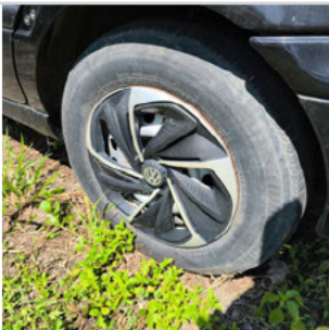
PNEU TRASEIRO ESQUERDO