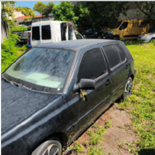
COLUNA DIANTEIRA ESQ