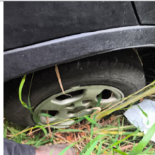
PNEU TRASEIRO DIREITO