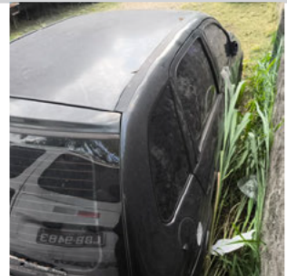
COLUNA TRASEIRA DIR