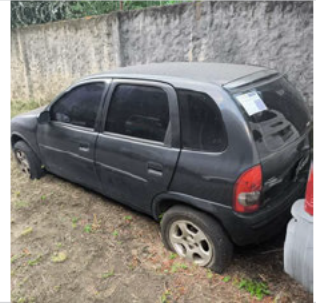
COLUNA TRASEIRA ESQ