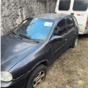
COLUNA DIANTEIRA ESQ