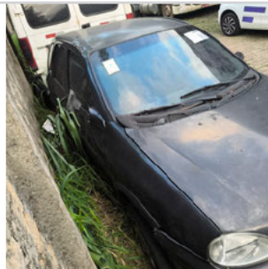
COLUNA DIANTEIRA DIR