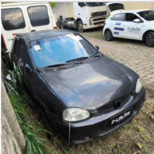
DIANTEIRA DIAGONAL DIREITA