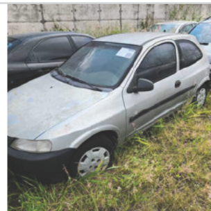
DIANTEIRA DIAGONAL ESQUERDA