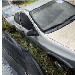
COLUNA DIANTEIRA DIR