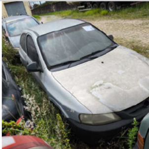
DIANTEIRA DIAGONAL DIREITA