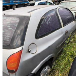
TRASEIRA DIAGONAL DIREITA