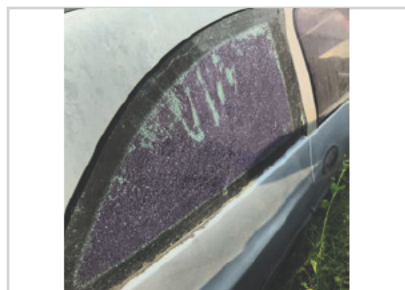
Vidro Traseiro Direito: