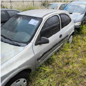
COLUNA DIANTEIRA ESQ