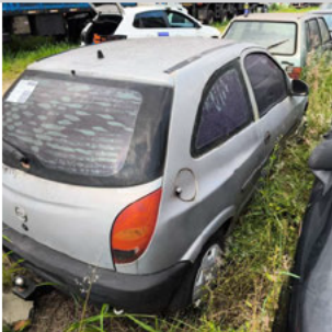
COLUNA TRASEIRA DIR