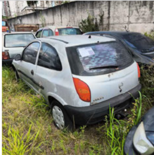
COLUNA TRASEIRA ESQ