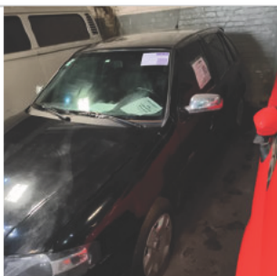
COLUNA DIANTEIRA ESQ