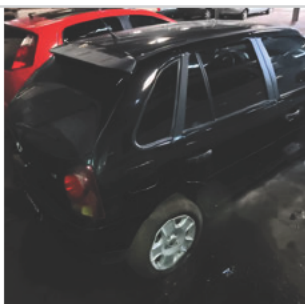
COLUNA TRASEIRA DIR