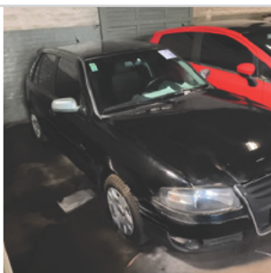
DIANTEIRA DIAGONAL DIREITA