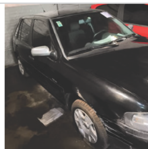
COLUNA DIANTEIRA DIR