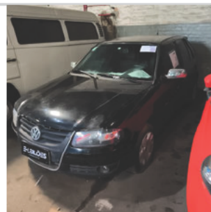
DIANTEIRA DIAGONAL ESQUERDA