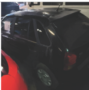
COLUNA TRASEIRA ESQ