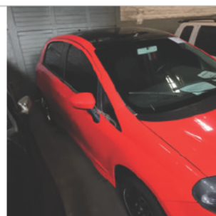
COLUNA DIANTEIRA DIR