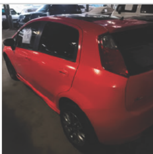
COLUNA TRASEIRA ESQ