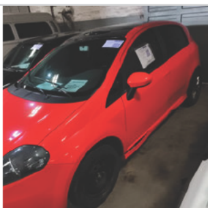
COLUNA DIANTEIRA ESQ