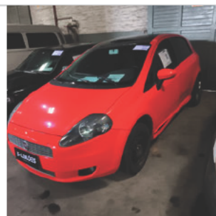
DIANTEIRA DIAGONAL ESQUERDA