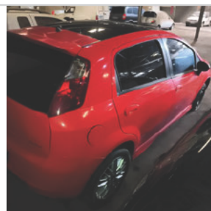
TRASEIRA DIAGONAL DIREITA