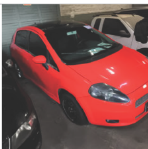
DIANTEIRA DIAGONAL DIREITA