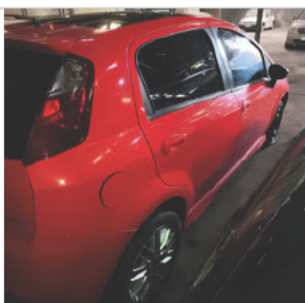
COLUNA TRASEIRA DIR