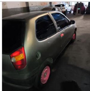
COLUNA TRASEIRA DIR