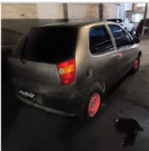
TRASEIRA DIAGONAL DIREITA