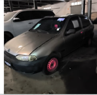
DIANTEIRA DIAGONAL ESQUERDA