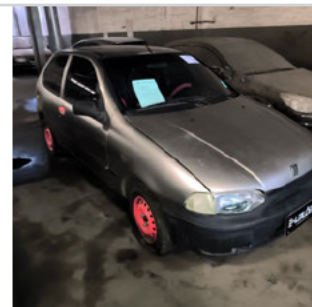
DIANTEIRA DIAGONAL DIREITA