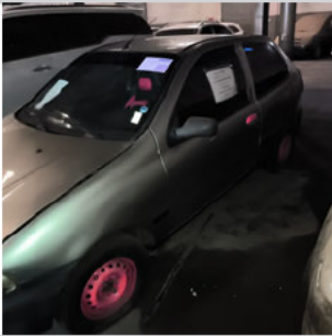
COLUNA DIANTEIRA ESQ