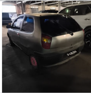
COLUNA TRASEIRA ESQ