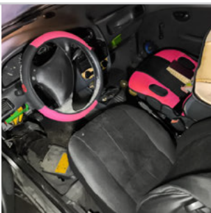
COLUNA DIANTEIRA DIR