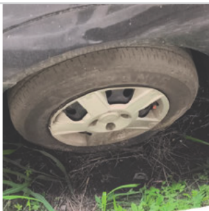
PNEU DIANTEIRO ESQUERDO