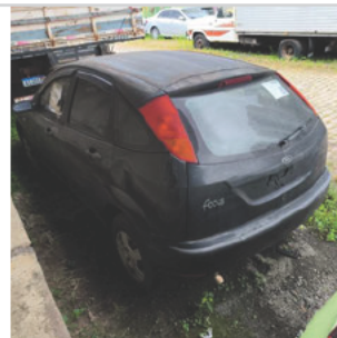
COLUNA TRASEIRA ESQ