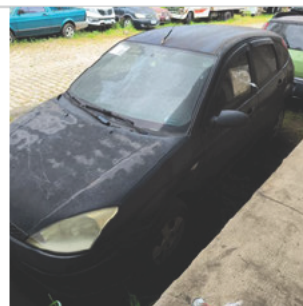
DIANTEIRA DIAGONAL ESQUERDA