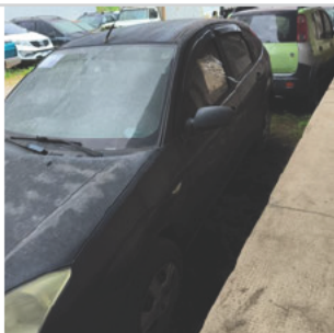
COLUNA DIANTEIRA ESQ