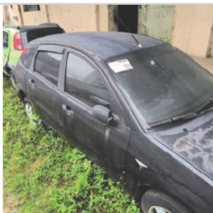
COLUNA DIANTEIRA DIR