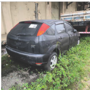
TRASEIRA DIAGONAL DIREITA