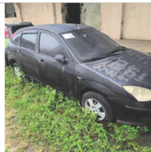
DIANTEIRA DIAGONAL DIREITA