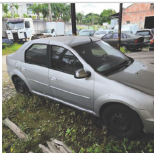
COLUNA DIANTEIRA DIR