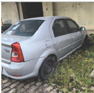
COLUNA TRASEIRA DIR