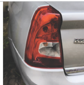
Lanterna Traseira Esquerda: Avariado Observação: QUEBRADA