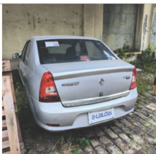
COLUNA DIANTEIRA ESQ