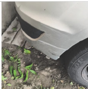
Parachoque Dianteiro: Avariado Observação: PEQUENO ARRANHÃO