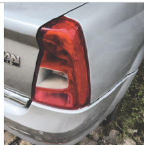
Lanterna Traseira Direita: Avariado Observação: QUEBRADA