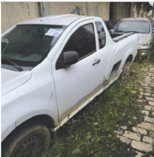
COLUNA DIANTEIRA ESQ