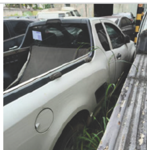
COLUNA TRASEIRA DIR