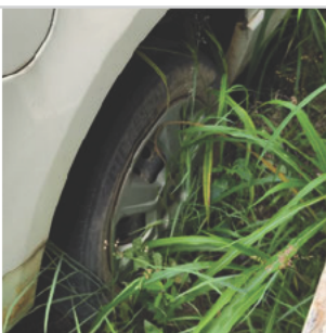
PNEU TRASEIRO DIREITO