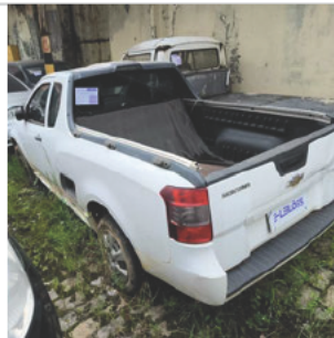
COLUNA TRASEIRA ESQ