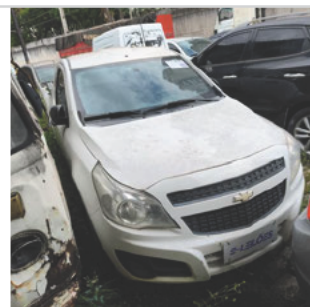
DIANTEIRA DIAGONAL DIREITA