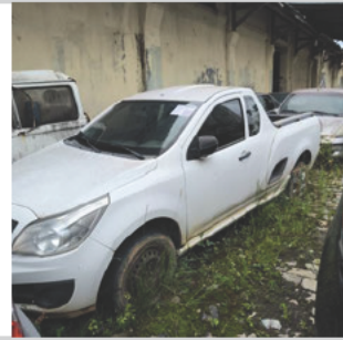
DIANTEIRA DIAGONAL ESQUERDA