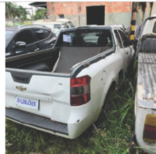
TRASEIRA DIAGONAL DIREITA