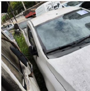
COLUNA DIANTEIRA DIR