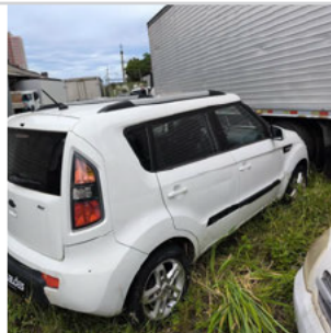
COLUNA TRASEIRA DIR