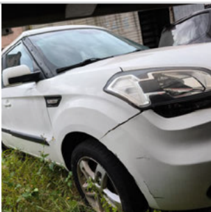
DIANTEIRA DIAGONAL DIREITA