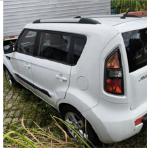
COLUNA TRASEIRA ESQ