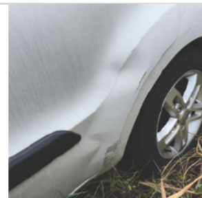
Porta Traseira Esquerda: ✗ Avariado Observação: AMASSADA