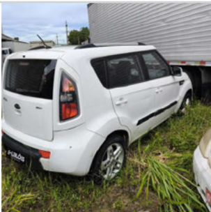
TRASEIRA DIAGONAL DIREITA