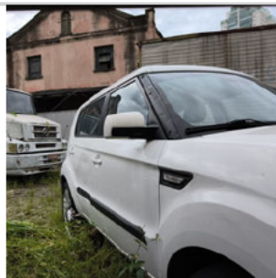
COLUNA DIANTEIRA DIR