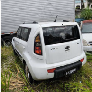
COLUNA DIANTEIRA ESQ