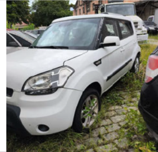
DIANTEIRA DIAGONAL ESQUERDA