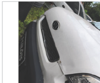
Capô: ✗ Avariado Observação: PEQUENOS AMASSADOS