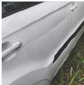
Porta Traseira Direita: ✗ Avariado Observação: RISCO NA PORTA