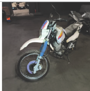
DIANTEIRA DIAGONAL ESQUERDA