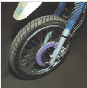
PNEU DIANTEIRO ESQUERDO