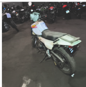
COLUNA TRASEIRA ESQ