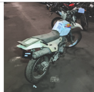
TRASEIRA DIAGONAL DIREITA