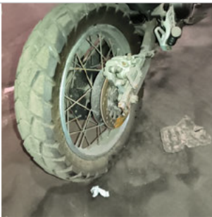
PNEU TRASEIRO DIREITO