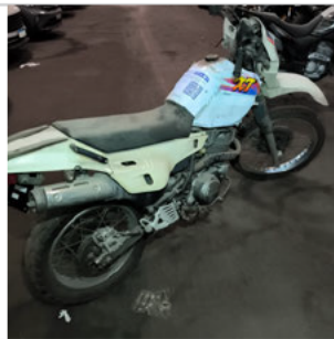
COLUNA TRASEIRA DIR