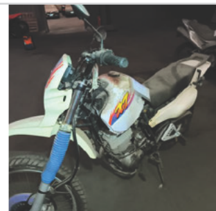
COLUNA DIANTEIRA ESQ