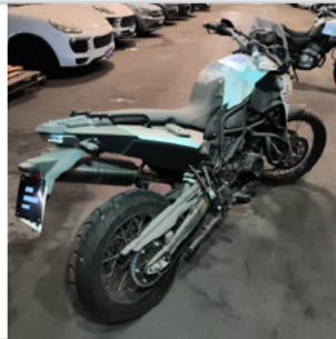
TRASEIRA DIAGONAL DIREITA