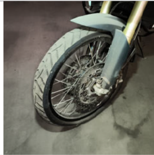
PNEU DIANTEIRO ESQUERDO