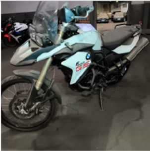
COLUNA DIANTEIRA ESQ