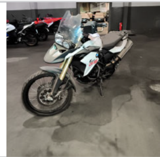
DIANTEIRA DIAGONAL ESQUERDA