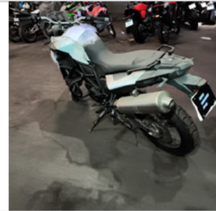
COLUNA TRASEIRA ESQ