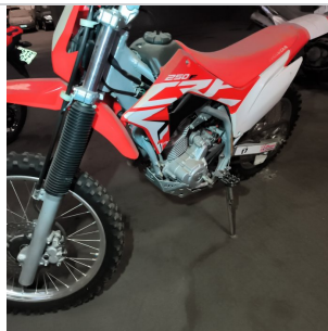
COLUNA DIANTEIRA ESQ