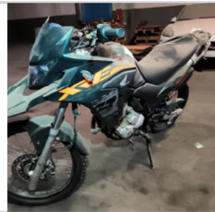
COLUNA DIANTEIRA ESQ