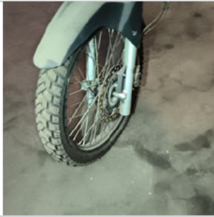
PNEU DIANTEIRO ESQUERDO