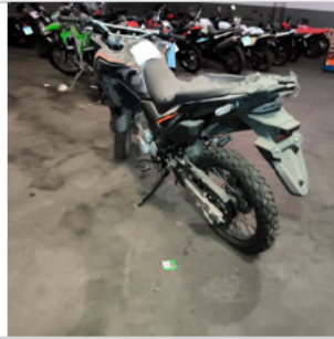
COLUNA TRASEIRA ESQ