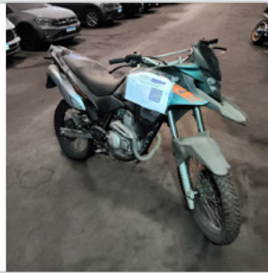
DIANTEIRA DIAGONAL DIREITA