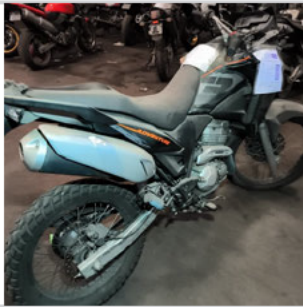
COLUNA TRASEIRA DIR