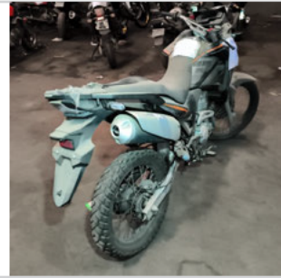
TRASEIRA DIAGONAL DIREITA