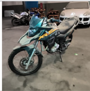
DIANTEIRA DIAGONAL ESQUERDA