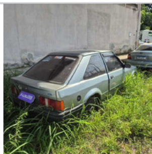
TRASEIRA DIAGONAL DIREITA