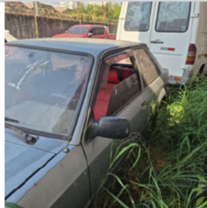
COLUNA DIANTEIRA ESQ