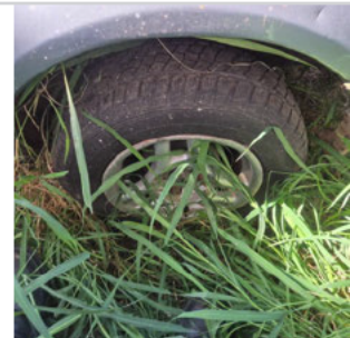
PNEU TRASEIRO ESQUERDO