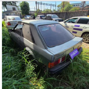
COLUNA TRASEIRA ESQ