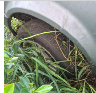
PNEU DIANTEIRO ESQUERDO