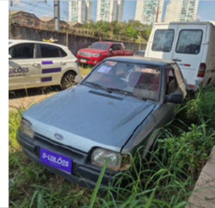
DIANTEIRA DIAGONAL ESQUERDA