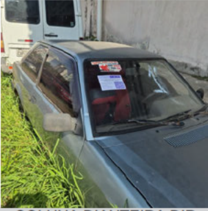
COLUNA DIANTEIRA DIR