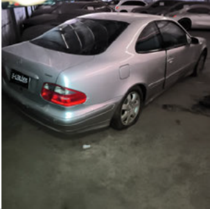
TRASEIRA DIAGONAL DIREITA