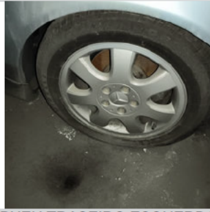
PNEU TRASEIRO ESQUERDO