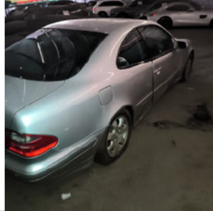
COLUNA TRASEIRA DIR