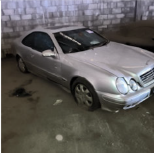
DIANTEIRA DIAGONAL DIREITA