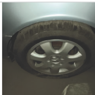
PNEU DIANTEIRO ESQUERDO