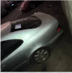
COLUNA TRASEIRA ESQ