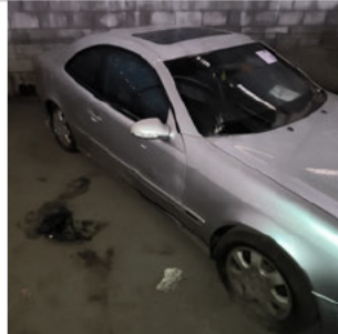
COLUNA DIANTEIRA DIR