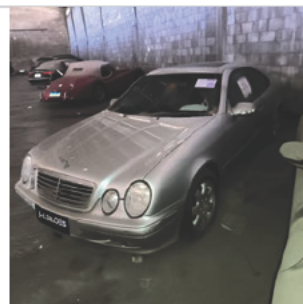
DIANTEIRA DIAGONAL ESQUERDA