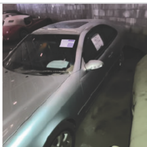
COLUNA DIANTEIRA ESQ